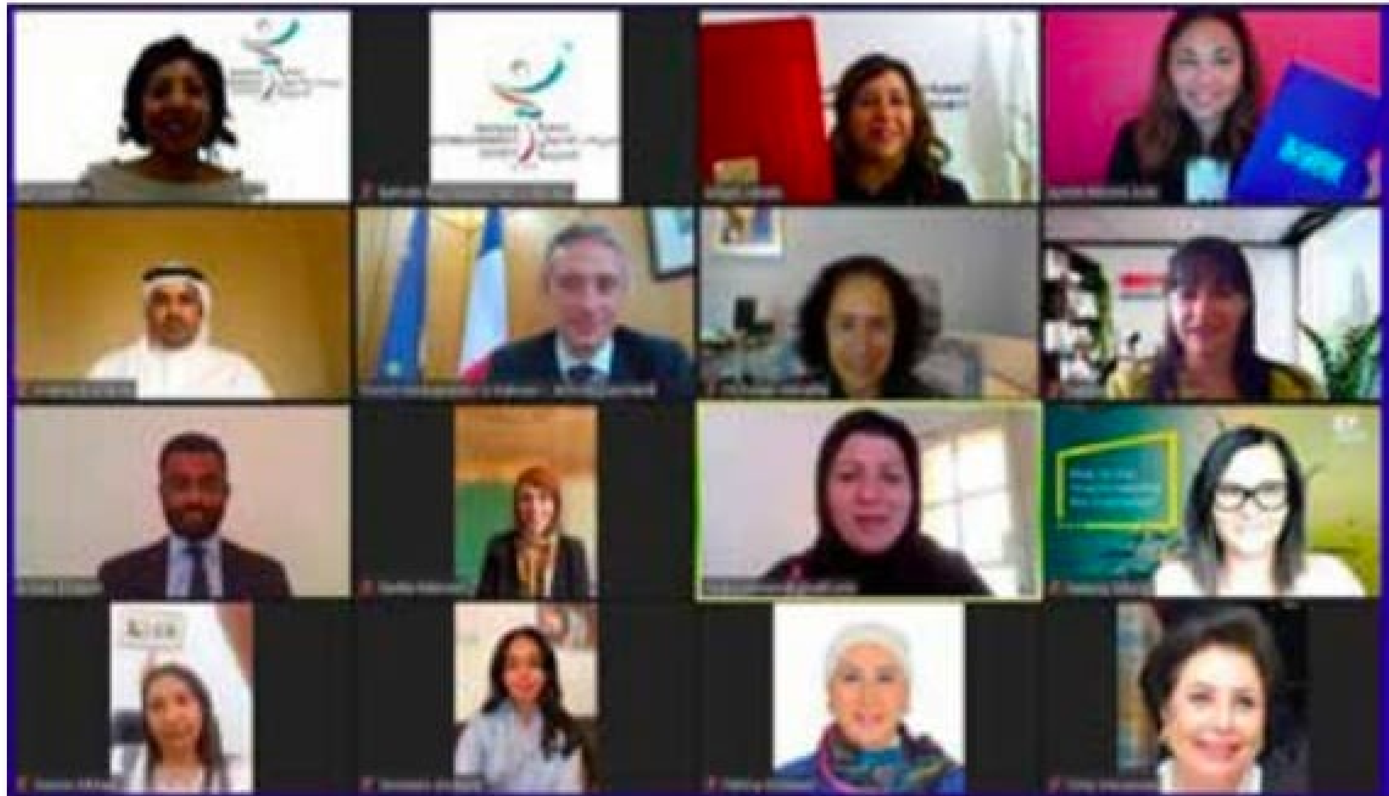
Officials during the deal signing